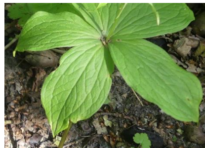
Foto 3. Blad bovenzijde