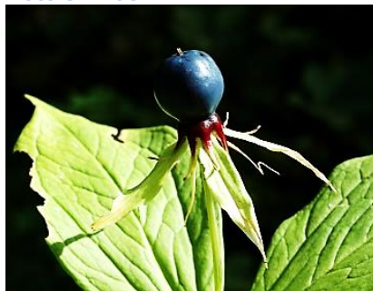
Foto 6. Vrucht