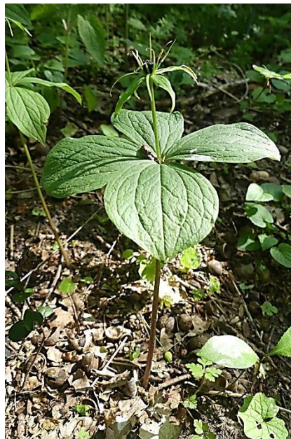
Foto 1. Eenbes

In het Fries, Frans, Duits en Engels noemt men de plant achtereenvolgens: Flouwerblêd, Parissette à quatre feuilles, Vierblättrige Einbeere en Herb-Paris.