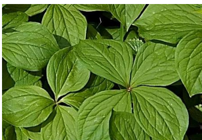
Foto 8. Bloemloze Eenbes