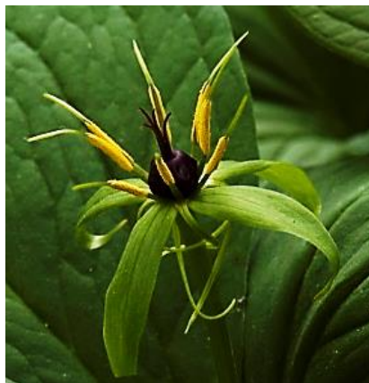
Foto 5. Bloem

We zullen de plant tegen kunnen komen in kalkrijke loofbossen met beekje en/of bron bij de hand.