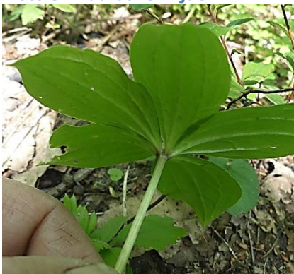
Foto 4. Blad onderzijde