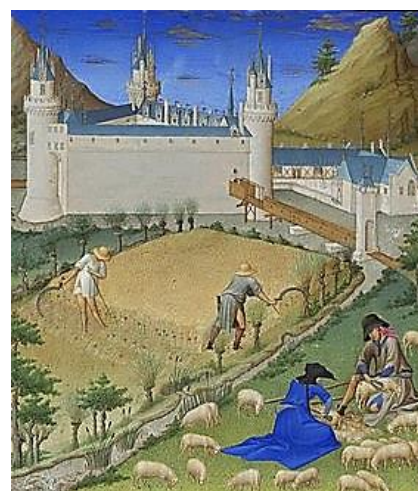
Afb. 2. Juli