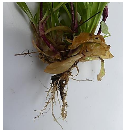
Foto 4. Wortelstelsel

Echte . Van de Koekoeksbloemen zal dit dan wel de echte moeten zijn.