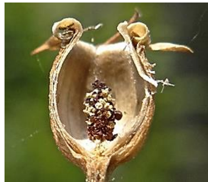
Foto 9. Vruchtdoos