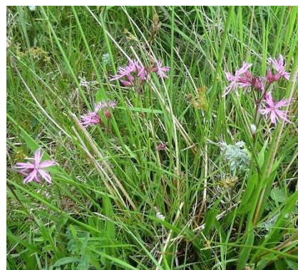
Foto 1. Echte koekoeksbloem