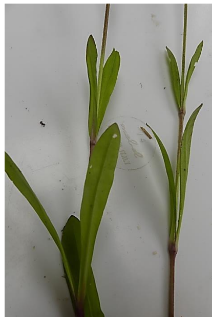
Foto 5. Bladstand

Vruchten. Het vruchtbeginsel is bovenstandig. De doosvrucht (foto 9) is ongesteeld en bevat slechts één hok, geen tussenschotten. De vruchtdoos opent zich met vijf tanden die niet terugbuigen. De zaden zijn lang kiemkrachtig.