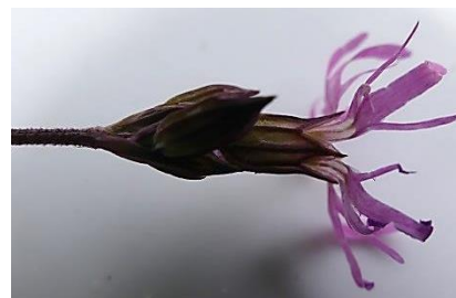
Foto 7. Bloem - kelk