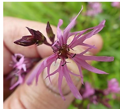
Foto 8. Bloem - kroon