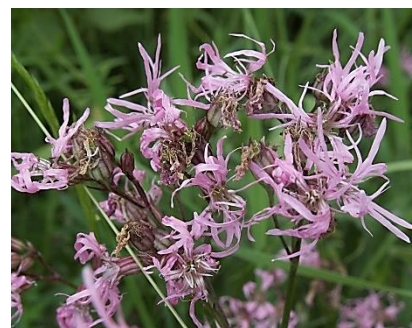
Foto 6. Bloeiwijze