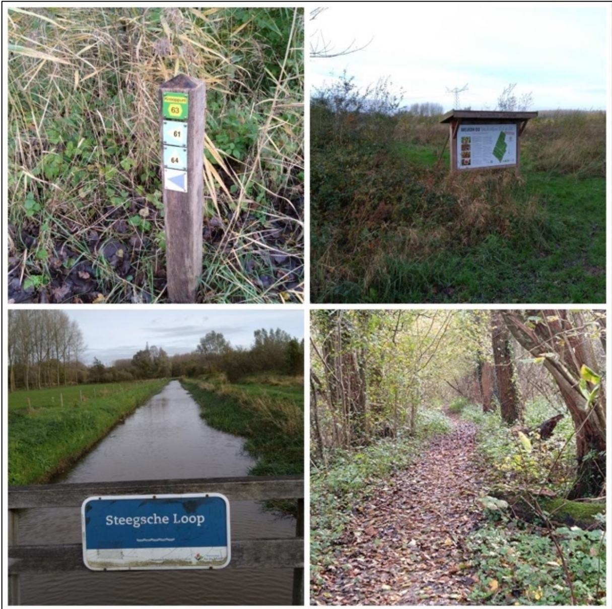
Diverse foto's langs route 4.

RA = rechtsaf; LA = linksaf; RD is rechtdoor