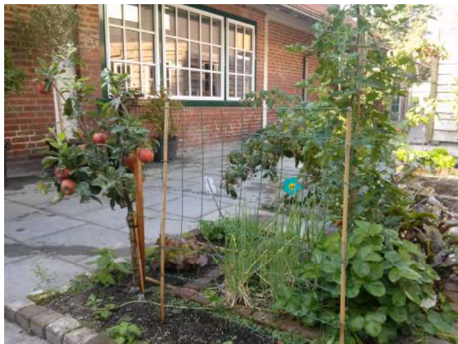
Dat de kinderen respect hebben voor de natuur en voor elkaars tuintjes blijkt uit de appeltjes die aan het boompje hangen.